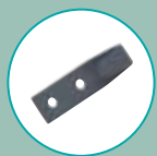
CROCHET MURET PLASTIQUE