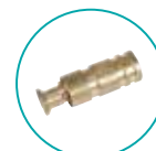
ANCRAGE TÉLESCOPIQUE LAITON