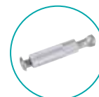
ANCRAGE TÉLESCOPIQUE ALU PLAGE BÉTON