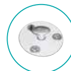
ANCRAGE TÉLESCOPIQUE PLAGE BOIS (INOX/DOUILLE ALU)