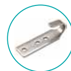
CROCHET MURET INOX