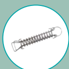
RESSORT INOX DE SÉCURITÉ