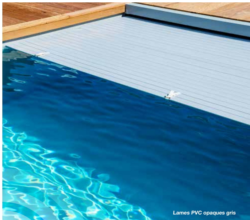
Lames PVC opaques gris