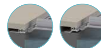
A - Rails plats B - Rails épargne hung