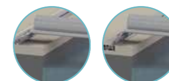
C - Rails à visser sur plage D - Rails encastrés sur plage